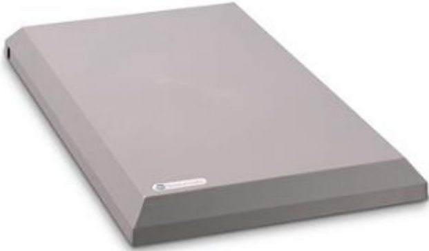
LP Pad Pro cabe bajo mostradores y correas transportadoras.