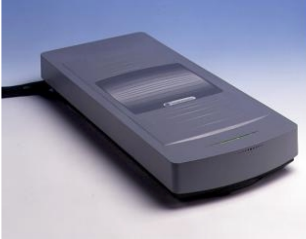
El PowerPad Pro está disponible como desactivador de superficie, bajo el mostrador o al borde del mostrador.