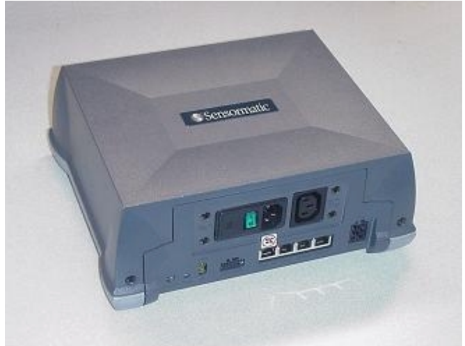
El controlador compacto ScanMax Pro presenta opciones de montaje de superficie, vertical y bajo el mostrador.